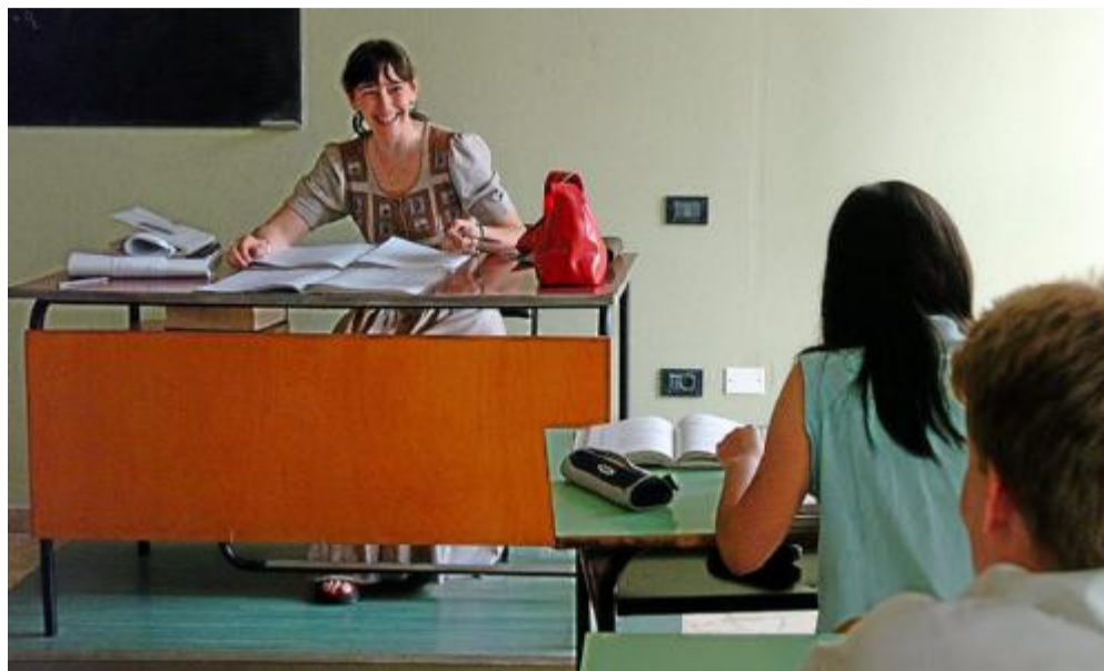
La Cisl è sempre più vicina al personale della scuola

«In attesa di affrontare la piattaforma di rinnovo di contratto - prosegue il segretario - sono già iniziati confronti ed approfondimenti su contenuti che non possono essere trascurati, come l'orario di lavoro, la formazione, la professionalità e il merito. Questi temi necessitano della dovuta attenzione e delicatezza, dal momento che il personale della scuola ricopre un ruolo fondamentale nella formazione delle persone: l'istruzione e la formazione operano, infatti, a favore degli interessi generali, della formazione delle risorse umane, della possibilità per tutti di raggiungere il personale successo formativo. E' impensabile ridurre questioni tanto rilevanti al semplice gradimento da parte dell'utenza, come la storia recente del merito "alla Brunetta" ha tentato di fare. Proprio grazie all'azione della Cisl, insieme a Uil, Gilda e Snals, si è riusciti a bloccare il